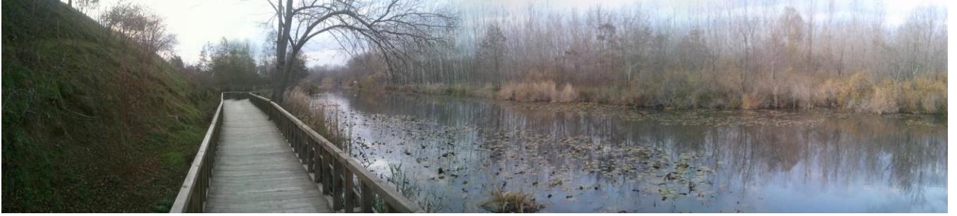
Acarlar Longoz’unda gün batarken

“Kış aylarında ve yağmurlu havalarda doğal atmosferinde görmeyi, piknik manzaralarında işgal edilmiş vaziyette bahar aylarında görmeye tercih ederim.”